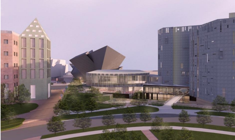
Representación del Museo de Arte de Denver y el campus de la Biblioteca Central de Denver

Para obtener más información sobre el Museo de Arte de Denver, visitar: http://denverartmuseum.org Para obtener más información sobre la Biblioteca Central de Denver, visitar: http://www.denverlibrary.org